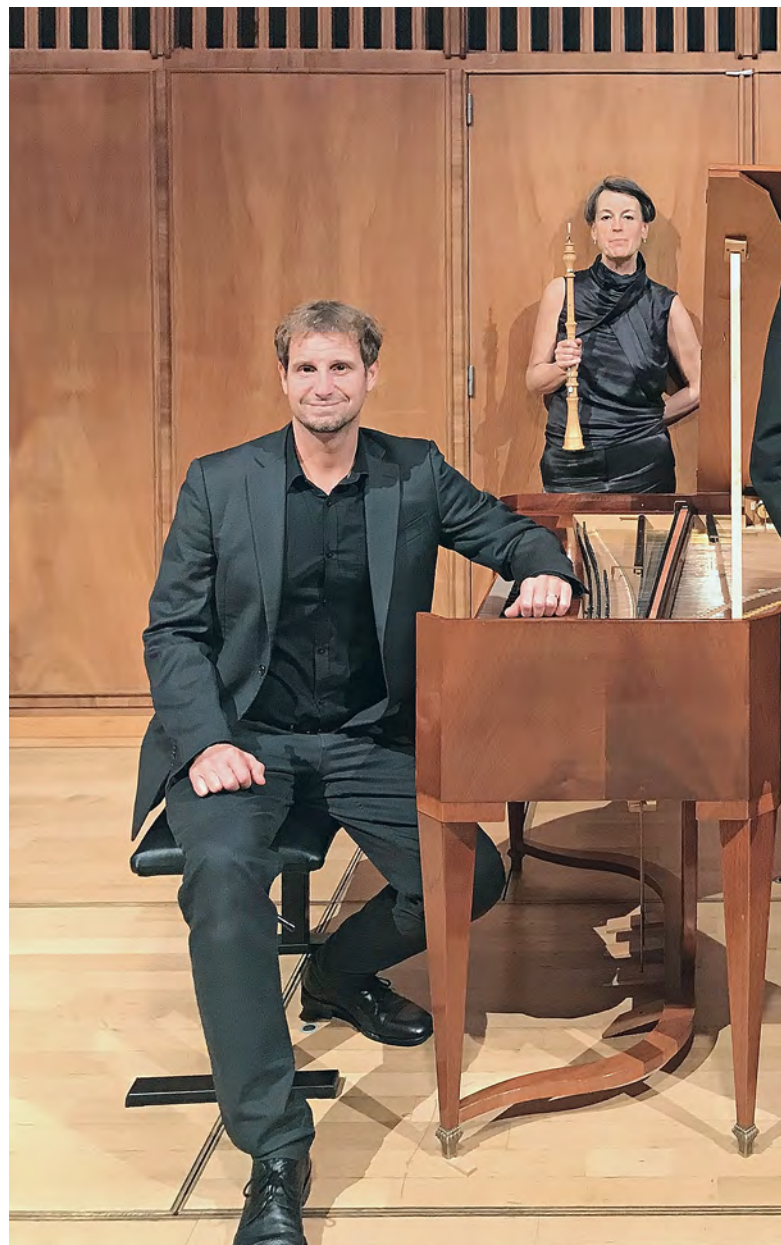
Interpretieren den Barock voller Emotionen: Die Musikerinnen und

Seit 2002 hat Die Freitagsakademie in Bern ihre eigene Konzertreihe. Blasinstrumente geben den Ton an, aber die Besetzungen sind sehr verschieden. Das Ensemble lädt Kollegen aus ganz Europa ein und ist sehr gut im europäischen Netzwerk der Originalklang-Szene integriert. Die Musik des 18. Jahrhunderts ist